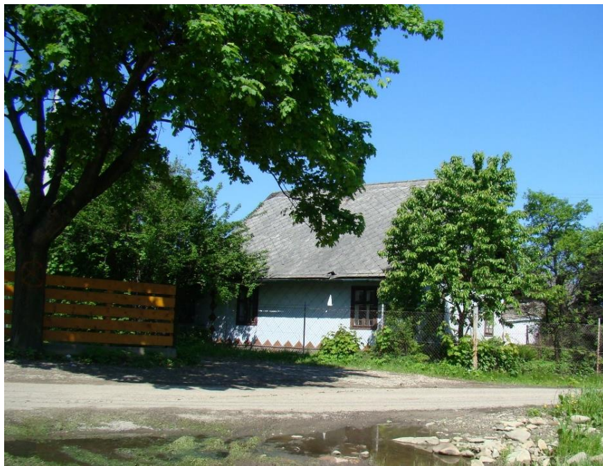
Widok od str. pn

8. Fotografia z opisem wskazującym orientację albo mapa z zaznaczonym stanowiskiem archeologicznym