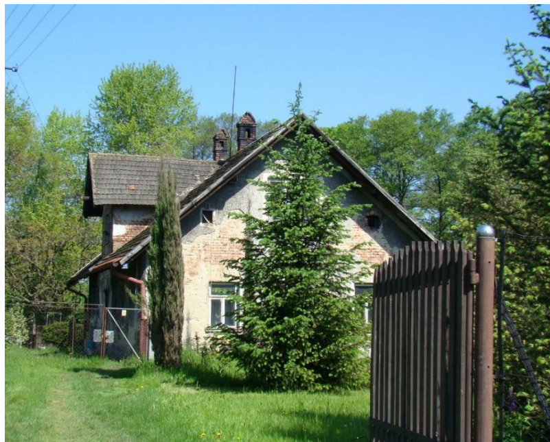
Widok domu od strony pd-wsch

8. Fotografia z opisem wskazującym orientację albo mapa z zaznaczonym stanowiskiem archeologicznym