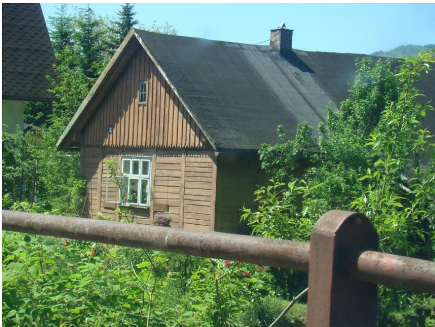
Widok domu od strony wsch

8. Fotografia z opisem wskazującym orientację albo mapa z zaznaczonym stanowiskiem archeologicznym