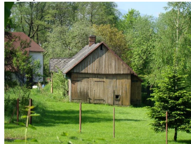
Widok domu od strony pn