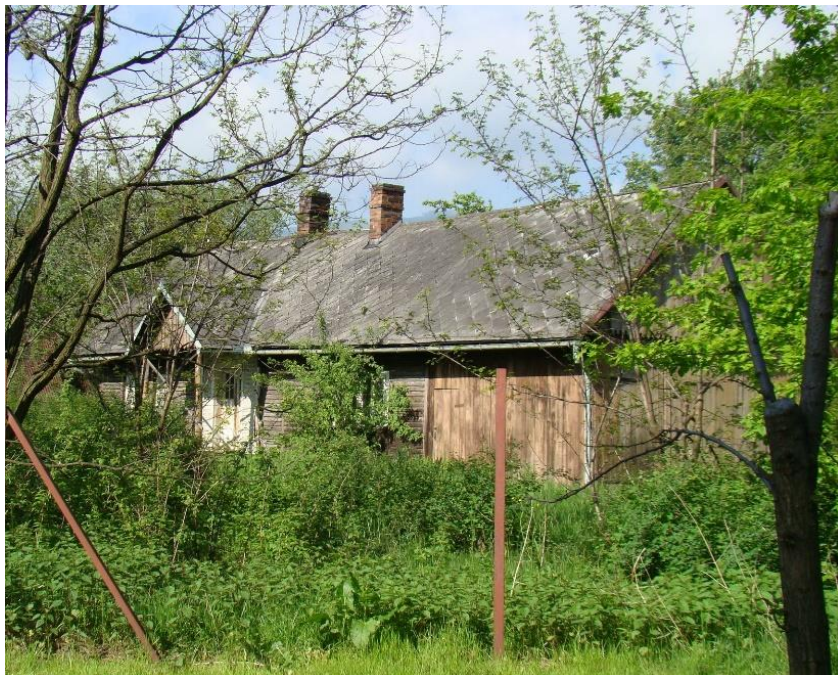
Widok domu od strony wsch

8. Fotografia z opisem wskazującym orientację albo mapa z zaznaczonym stanowiskiem archeologicznym