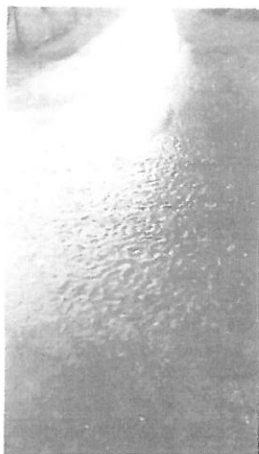
Zdjęcie 1: Studzienka w trakcie opadów

Jestem świadom, że intensywne zjawiska atmosferyczne są trudne do opanowania i zawsze stwarzają zagrożenie. Nie zawsze jesteśmy w stanie wszystko przewidzieć. Jestem jednak przekonany, że podjęcie działań prewencyjnych w tym zakresie, poprzez regularny przegląd i czyszczenie studzienek, pozwoli w znaczny sposób poprawić odbiór wody z dróg. Zdaję sobie sprawę z ilości obiektów, które występują na drogach oraz pracy jaką trzeba włożyć, aby to zorganizować.