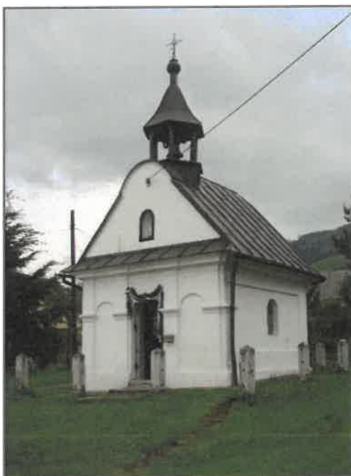
Rysunek 8. Kapliczka murowana w miejscowości Meszna