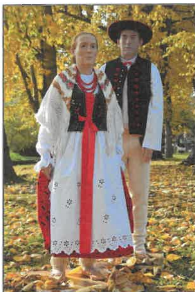
Rysunek 5. Manekiny dawnych mieszkańców gminy Wilkowice w strojach ludowych Górali Żywieckich