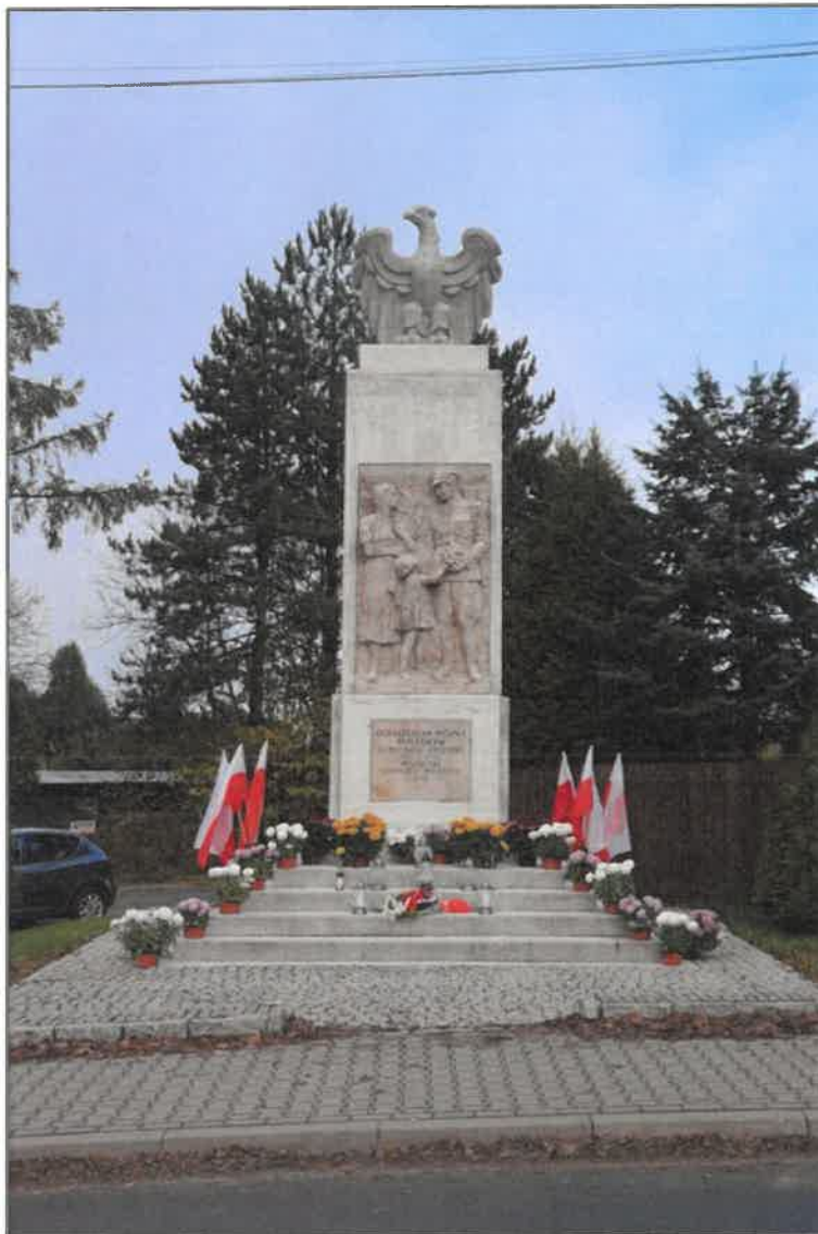
Rysunek 12. Pomnik Bohaterom Poległym za Ojczyznę (1939 – 1945) w Wilkowicach