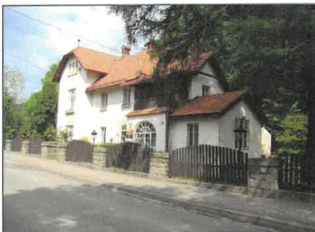
Rysunek 6. Willa "Fałatówka" Widok willi od strony południowo-wschodniej