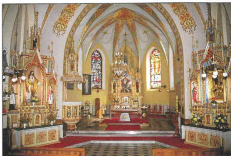
Rysunek 10. Wnętrze Kościoła pw. Michała Archanioła w Wilkowicach

Obecny wystrój kościoła pochodzi z pierwszych lat XX wieku. Chrzcielnicę wykonano w 1941 roku, a jej pokrywę zrobiono na 1000-lecie chrztu Polski. Organy 15-sto głosowe znajdujące się w kościele zbudowała firma Rieger z Jagerdorf w 1909-1910 roku. Pająki, które obecnie oświetlają kościół, pochodzą z 1889 roku (mały pająk przeniesiony ze starego kościoła) oraz z 1937 rok (większy pająk) 19 .