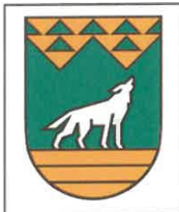
Rysunek 3. Samodzielny sygnet Gminy Wilkowice