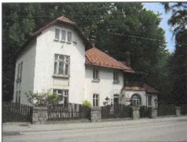
Rysunek 7. Willa "Fałatówka" Widok willi od strony południowej