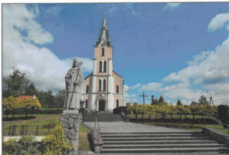
Rysunek 9. Kościół pw. Michała Archanioła w Wilkowicach