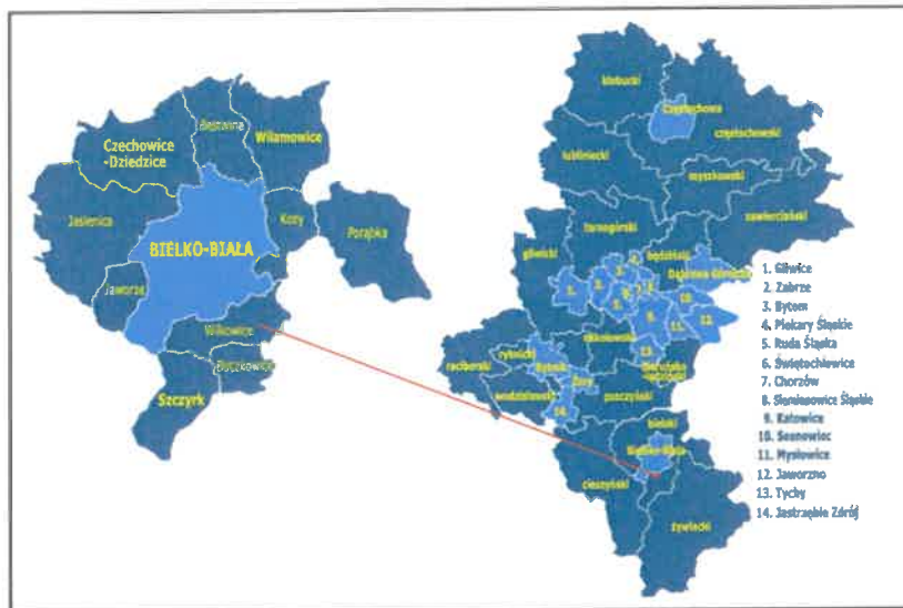
Rysunek 1. Położenie gminy Wilkowice na tle powiatu bielskiego i województwa śląskiego