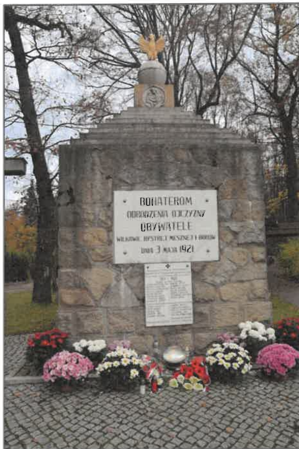
Rysunek 11. Pomnik Bohaterów Odrodzenia Ojczyzny (1914 – 1920)